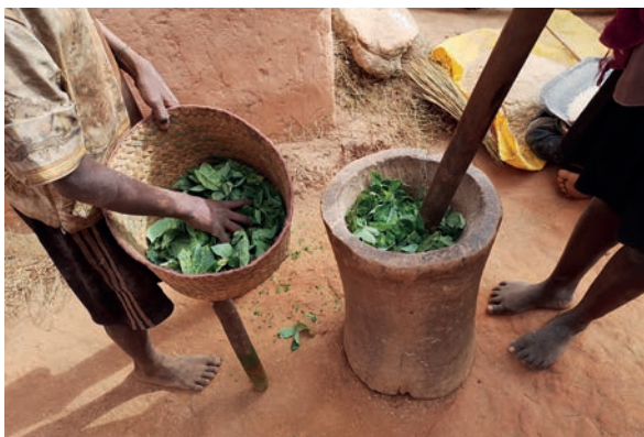
In einem Dorf im Hochland von Madagaskar werden Maniokblätter gestampft.

Zum madagassischen Neujahrsfest wird oft Tatao gegessen, dass ist in Milch gekochter Reis mit Honig, der unserem Milchreis ähnlich ist.